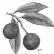
Medronheiro Arbutus unedo