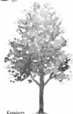
Freixo Fraxinus angustifolia