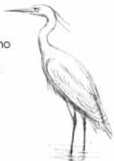
Garça-branca-pequena Egretta garzetta