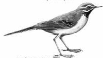
Alvéola cinzenta Motacilla cinerea