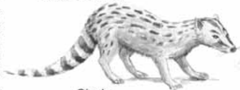
Gineta Genetta genetta