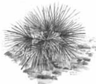
Palmeira-anã Chamaerops humilis