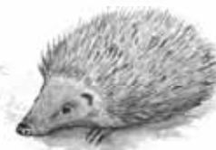
Ouriço-cacheiro Erinaceus europaeus