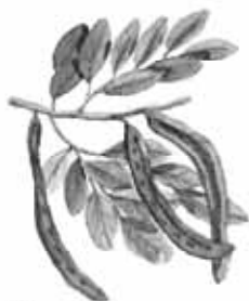
Afarrobeira Ceratonia siliqua