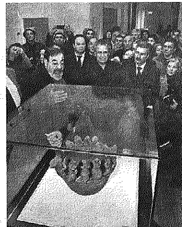
Vaso islâmico em exposição