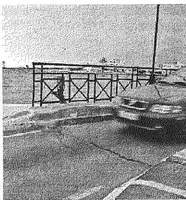
Ponte para a praia de Faro

Segundo a Sociedade Polis, a nova ponte terá uma faixa de rodagem de sentido alternado (como a actual), uma via para bicicletas e uma para peões. A ponte actual apenas será demo-