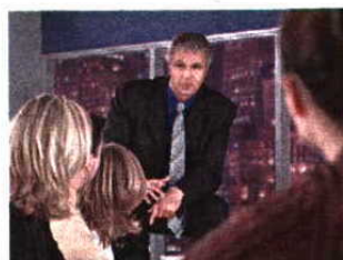
■ É pedida participação para a assistência técnica

Poiares Maduro reforçou as ideias de rapidez e responsabilização dos gestores dos projetos. "Estabelecemos prazos máximos nos pagamentos e processo de seleção, que nem sempre ocorreram. Mas não basta esta-