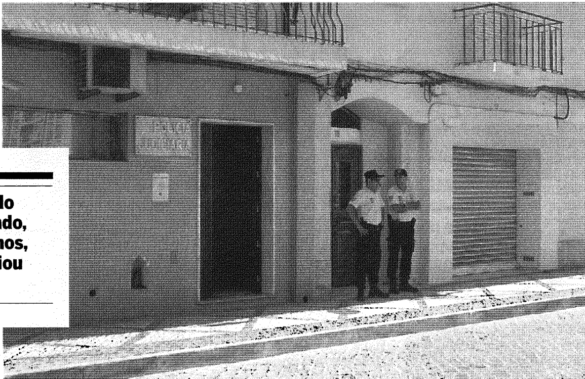
Departamento de Investigação Criminal da PJ de Portimão capturou os dois suspeitos

Amigo do reformado, de 61 anos, denunciou o caso