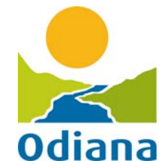
Imagem institucional dos Jogos 2009