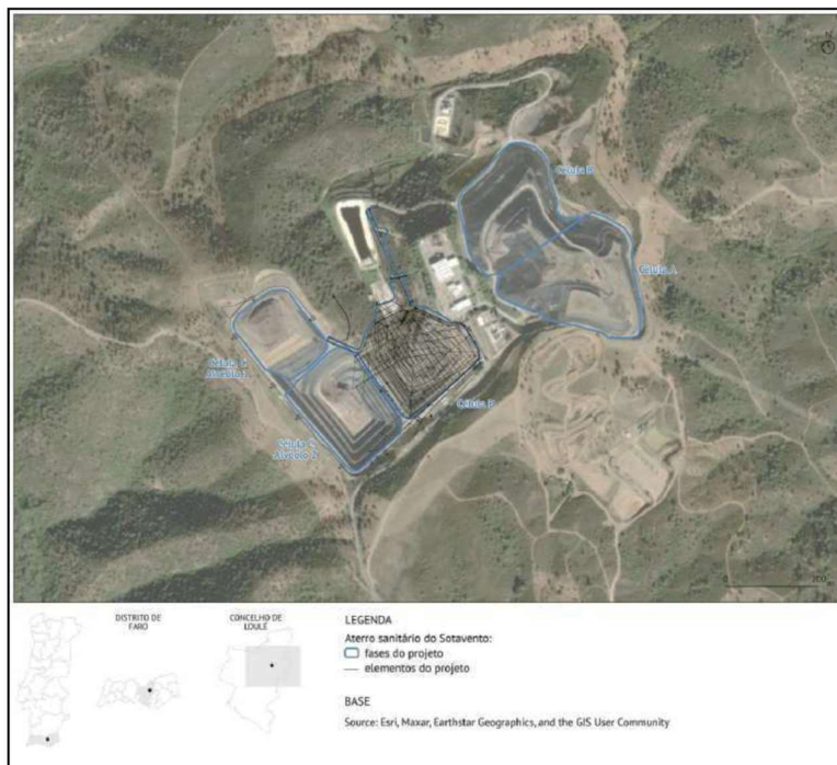
Figura 2 – Implantação da Célula D e faseamento do Aterro Sanitário do Sotavento.