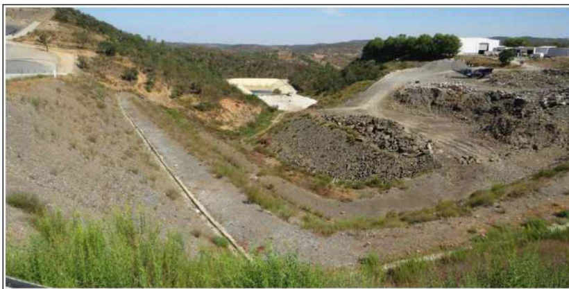
Figura 1 - Local da implantação da Célula D, mostrando escombros da escavação da Célula C (Visto do Sul, com aterro de confinamento da Célula C à esquerda, edifícios à direita, plataforma e lagoa de lixiviados ao fundo) (Fonte: Elementos do EIA).

A célula D será independente das restantes, mas partilhará algumas das infraestruturas comuns, destinando-se exclusivamente à deposição de resíduos sólidos urbanos, de acordo com o Decreto-Lei n.º 102-D/2020, de 10 dezembro, que estabelece o Regime Geral de Gestão do Resíduos (RGGR) e o Regime Jurídico da Deposição de Resíduos em Aterro (RJDR).