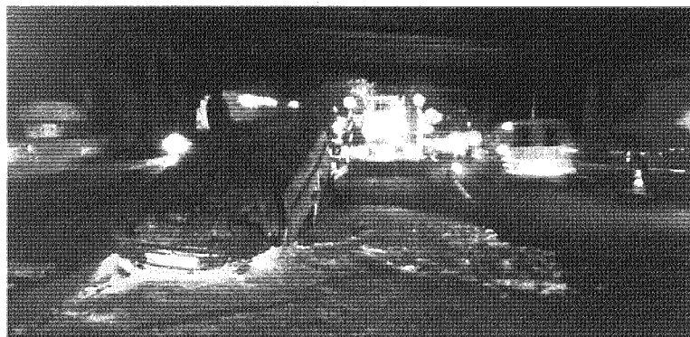
Após o embate, um dos veículos ficou capotado na estrada

ACIDENTE ENTRE DOIS VEÍCULOS NA ZONA DO RIO SECO, NA NOVA VARIANTE NORTE