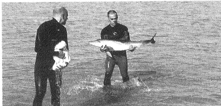
Golfinho bebé foi resgatado por surfistas na praia do Molhe

ANIMAL ENCONTRADO POR SURFISTAS NA PRAIA DO MOLHE ACABOU POR MORRER NO LOCAL QUANDO ESTAVA A SER ASSISTIDO