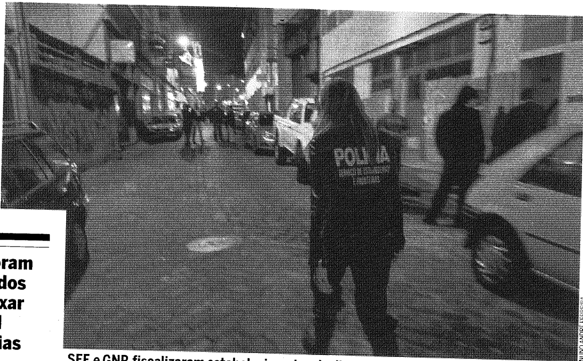
SEF e GNR fiscalizaram estabelecimentos de diversão noturna em Albufeira

Esta operação de fiscalização conjunta foi desencadeada “no âmbito da missão de controlo de atividade e permanência de estrangeiros em território nacional”, explica o SEF. ■