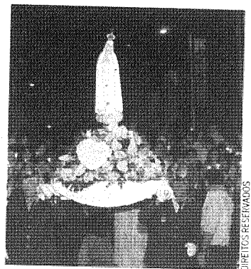
Visita da imagem peregrina

A chegada da imagem está prevista para as 15h30, no Ameixial, onde terá lugar uma cerimónia ministrada por D. Manuel Neto Quintas, Bispo do Algarve. A imagem peregrina iniciou em maio deste ano uma peregrinação de um ano às dioceses portuguesas, chegando ao Algarve vinda de Beja. ■ P.F.G.