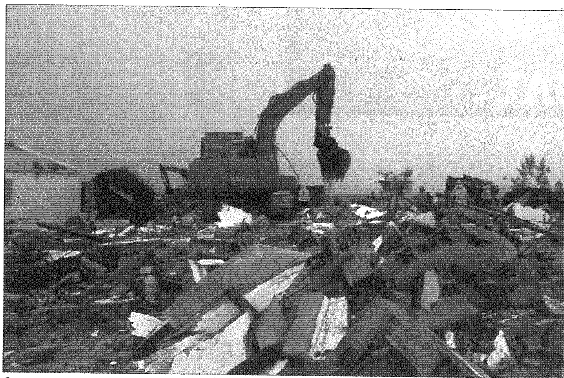
Casas começaram a ser demolidas por máquinas nas ilhas-barreiras da ria Formosa e na praia de Faro